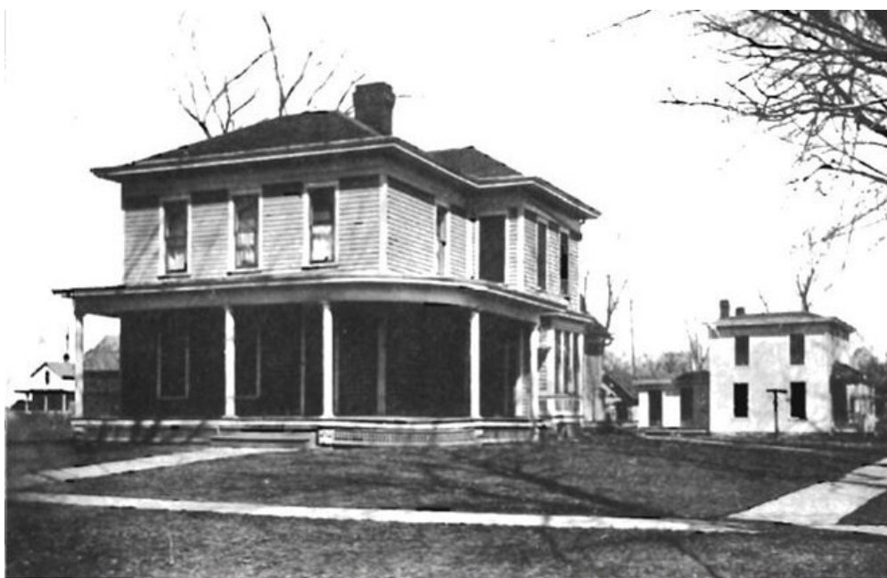
La vecchia casa di Hyde a Carthage, nell'Illinois, dove fu portato il corpo del missionario prima del funerale, svoltosi nella Chiesa Presbiteriana della città.

Il materiale riprodotto è stato estratto, tradotto e liberamente adattato da Ciro Izzo , dal libro “Praying Hyde or, A present day challenge to prayer?” , a cura di E.G. Carre .